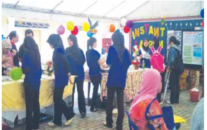
Pameran produk yang dijalankan oleh para peserta.